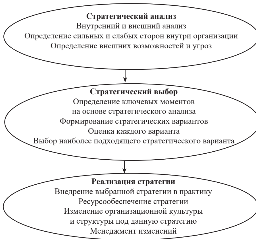
Рис. 1. Линейно-рациональный стратегический процесс [7, с. 112, 219]

повторять один и тот же параметр в разных блоках. При сложном анализе возникает хаос понятий, неоднозначных характеристик, их дублирование.