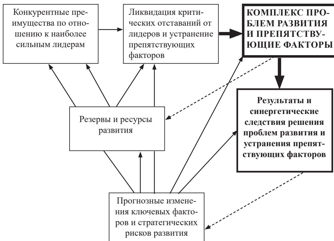
Рис. 3. Принципиальная технология стратегического анализа

Предлагается технология стратегического анализа (рис. 3), которую можно назвать «Поиск резервов и ресурсов создания конкурентных преимуществ для решения проблем развития» – это именно то, для чего и должен проводиться стратегический анализа.