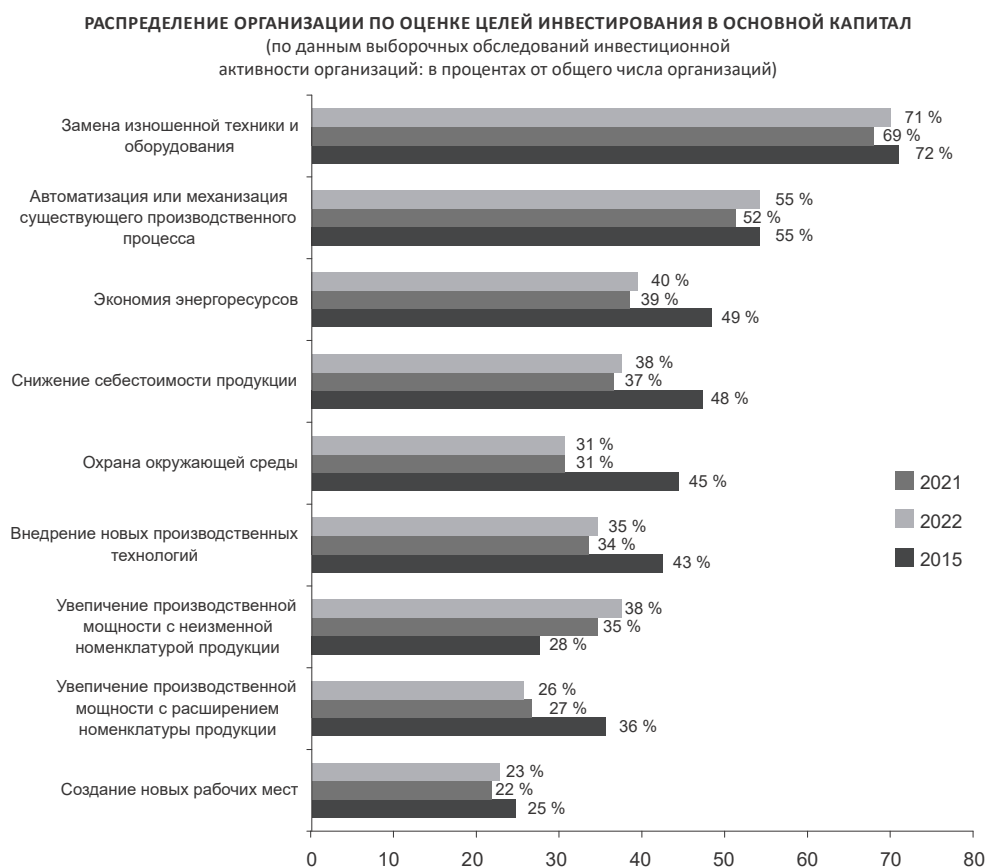
Рис. 2. Приоритеты инвестирования в промышленности РФ [2]

Тоже самое подтверждают и данные Росстата по оценке приоритетов инвестирования в экономике РФ, в которых объединяются совершенно разнородные по сущности и экономическим результатам направления – механизация и автоматизация: